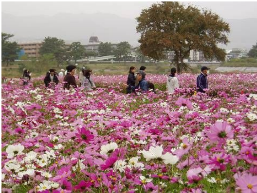
髭の渡しコスモス園

尼崎の新観光名所「髭の渡しコスモス園」には550万本のコスモスが咲き誇っています。また、昆陽池は渡り鳥の飛来池として有名で秋から冬にかけて多くの水鳥が飛来します。そして荒牧のバラ園は天津乙女など世界的に名高いバラの品種が生みだされたテラス式庭園で、世界のバラ約250種1万本が栽培されています。