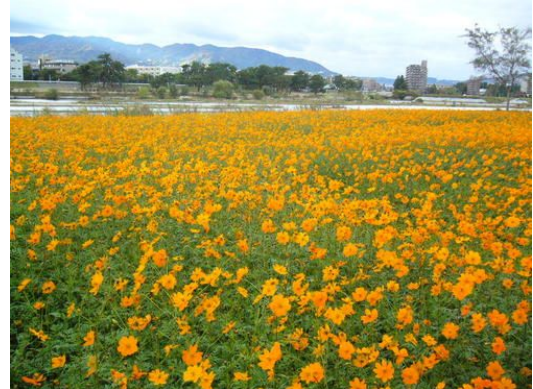
髭の渡しコスモス園